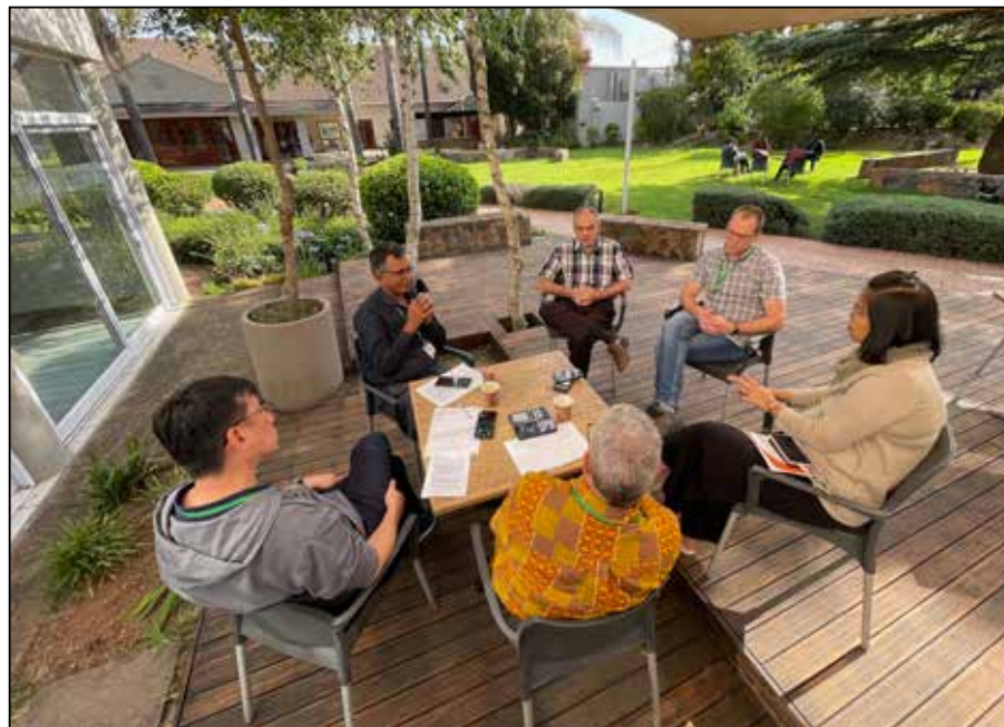
Johannesburg, South Africa.

tirer les leçons de leurs succès et de leurs échecs. Nous regardons l'avenir avec humilité et espoir.