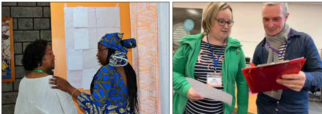
Left: Nairobi, Kenya. Right: Holzhausen, Germany.