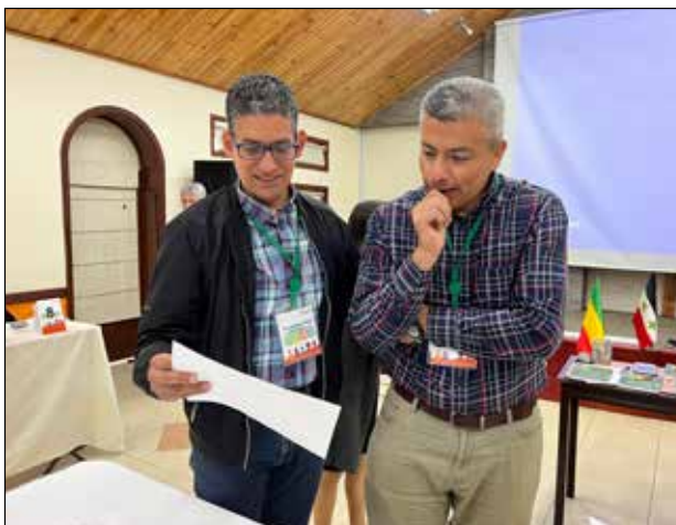
Bogota, Colombia.

Dans un effort continu pour discuter de ces réalités, l'Alliance a organisé cinq Conversations mondiales des peuples en 2023. Quatre de ces Conversations étaient régionales et se sont tenues en Allemagne, en Colombie, en Malaisie et au Kenya, avec un total de 120 participants (y compris les dirigeants de l'Alliance et plusieurs invités d'autres organisations) représentant 75 organisations et presque autant de pays. La cinquième Conversation, qui s'est tenue à Johannesburg, en Afrique du Sud, a rassemblé plusieurs représentants de chaque réunion régionale et la plupart des membres de l'équipe dirigeante de l'Alliance.