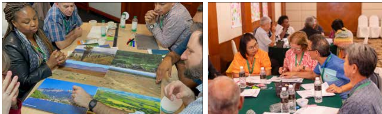
Left: Johannesburg, South Africa. Right: Kuala Lumpur, Malaysia.