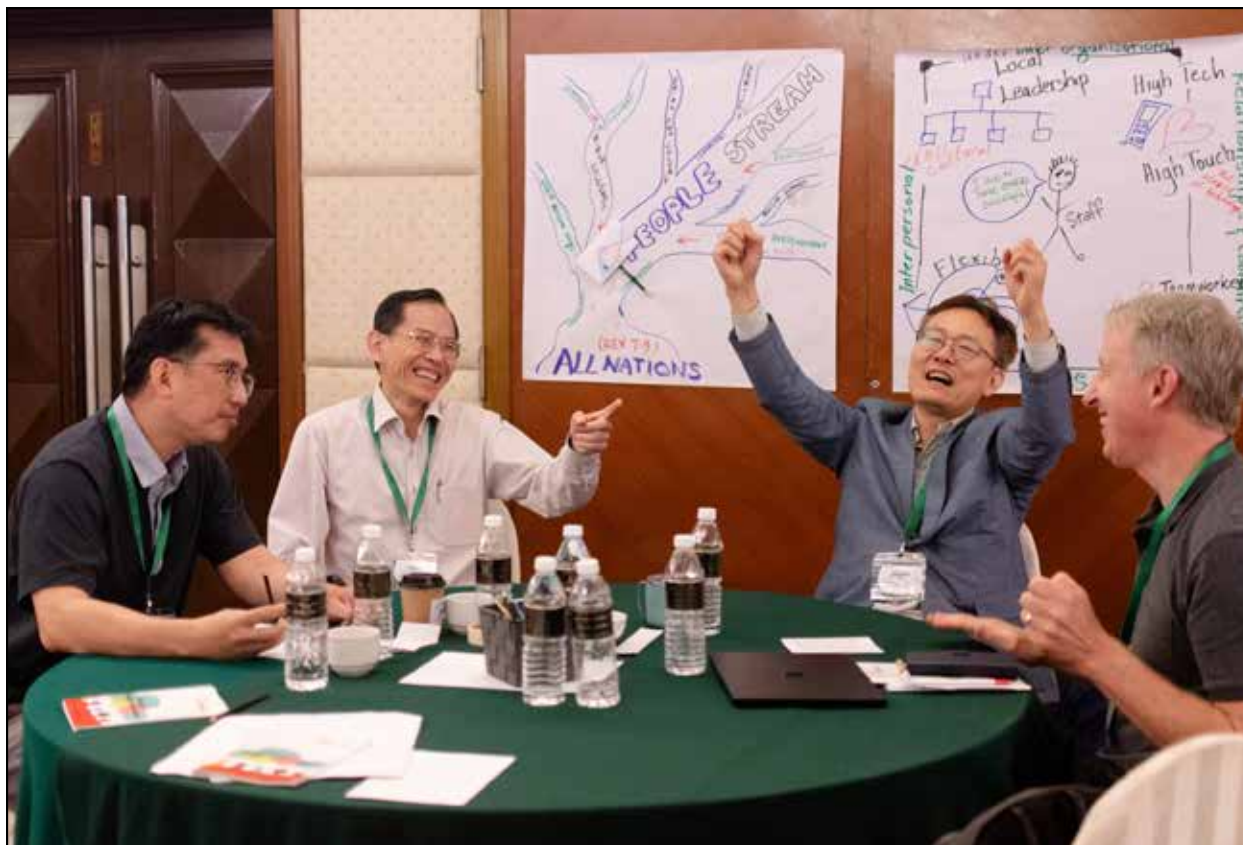
Kuala Lumpur, Malaysia.

Bible) font partie d'un même écosystème.