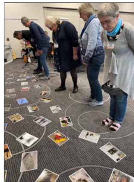
Holzhausen, Germany.

Les participants à la cinquième Conversation des peuples ont noté que, par le passé, lorsque les responsables parlaient de la participation des personnes à la traduction de la Bible, la discussion se concentrait souvent sur des questions pragmatiques concernant les « programmes et systèmes » ou la « restructuration des organisations et des processus ». « Le recrutement et la fidélisation », « les ressources humaines » et l'église en tant que ressource sont des thèmes de « mobilisation » courants. Toutefois, lors des Conversations des peuples de 2023, les discussions se sont concentrées sur le rôle central de l'église dans la mission de Dieu, sur la nature essentielle des relations, de la prière et de la collaboration. Les participants ont également reconnu la nécessité d'un changement significatif dans nos approches et nos perspectives.