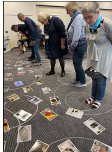
Holzhausen, Germany.

nizações e processos”. “Recrutamento e retenção”, “recursos humanos” e a igreja como “recurso” eram tópicos comuns de “mobilização”. Nas Conversas de 2023, no entanto, as discussões centraram-se na centralidade da igreja na missão de Deus, na natureza essencial dos relacionamentos, da oração e da colaboração. Os participantes também reconheceram a necessidade de mudanças significativas nas nossas abordagens e perspectivas.