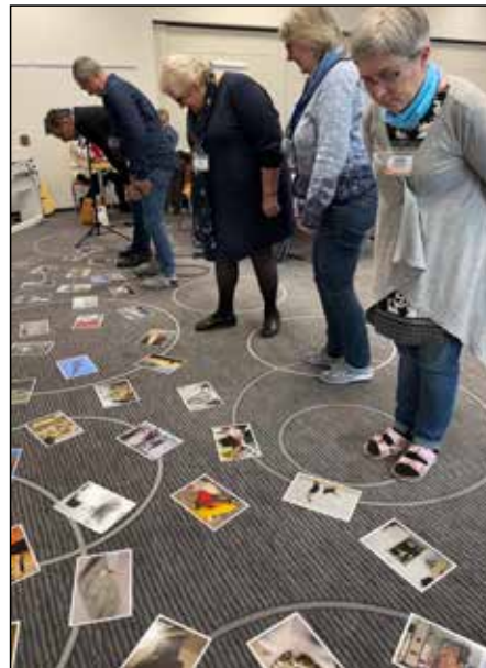
Holzhausen, Germany.

sering kali berfokus pada pertanyaan pragmatis mengenai “program dan sistem” atau “merestrukturisasi organisasi dan proses”. “Perekrutan dan retensi”, “sumber daya manusia”, dan gereja sebagai suatu “sumber daya” adalah topik “mobilisasi” yang sudah umum. Namun, pada People Conversations tahun 2023, diskusi berfokus pada sentralitas gereja dalam misi Allah, sifat penting dari jalinan hubungan, doa, dan kolaborasi. Para peserta juga mengakui perlunya perubahan signifikan dalam pendekatan dan perspektif kita.